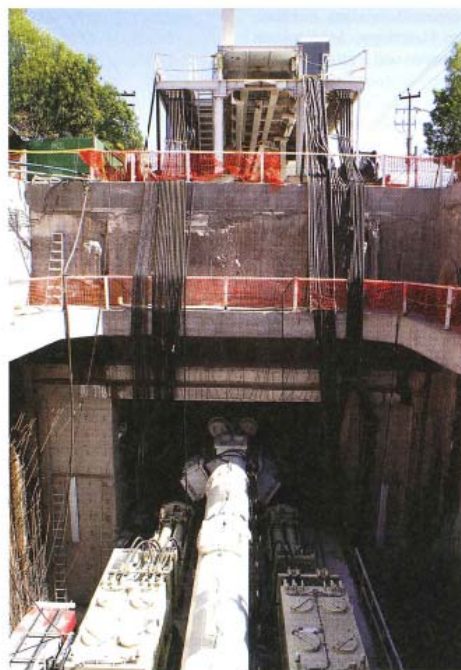
4 Der Vortrieb begann vom Schacht aus mit Verbindung zu den Nachläufern an der Erdoberfläche 4 Excavation with the TBM began from a shaft using umbilical cables attached to back-up decks on the surface

もともとメキシコシティはメキシコ湖の中に浮かぶ島であり、都市開発とともに湖は干拓された歴史がある。トンネル掘削地域では、主な地質は湖の粘土であり、時折、砂、砂利、最大 0.8m 径の玉石を含む。TBM の組み立ては、深さ 17m の 14m×34m のシャフト内にコンクリートのクレードルを作成して現地で行われた。また、TBM 本体は組み立て後すぐ発信できるように、コンクリート製クレードル内に 60° の角度で設置した 2 本のレール上で行われた。